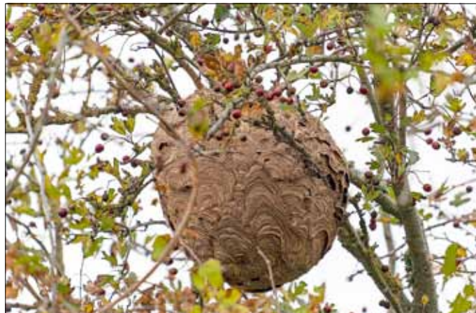
Nest der asiatischen Hornisse

Wie bei Bienen und Wespen sind Einzeltiere der asiatischen Hornisse generell harmlos, sofern man diese nur beobachtet. Meist werden Exemplare an Weintrauben oder Obst im heimischen Garten gesichtet und können bei der Futteraufnahme auch gefahrlos fotografiert werden.